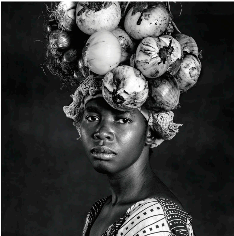
Personas que velan sueños ajenos